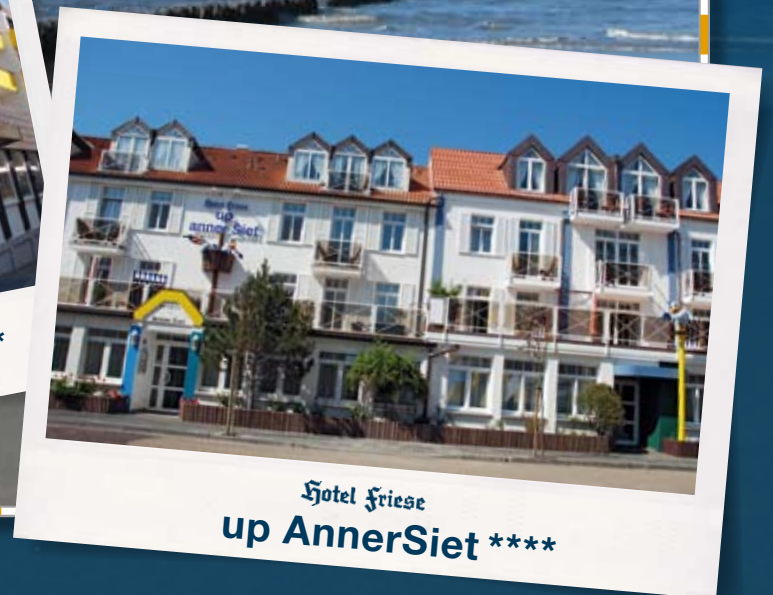
Hotel Friese up Annersiet ****