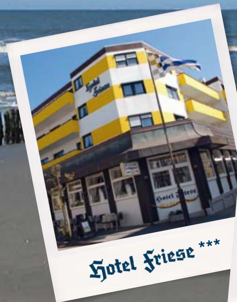
Hotel Friese ***

WILLKOMMEN IM HOTEL FRIESE UND IM HOTEL FRIESE – UP ANNERSIET!